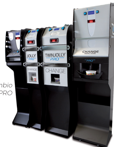
Máquina de cambio de la gama PRO

Amplia elección de aparatos para satisfacer cualquier necesidad de cambio : cada modelo garantiza rendimientos de seguridad impecables y una velocidad de dispensación incomparable.