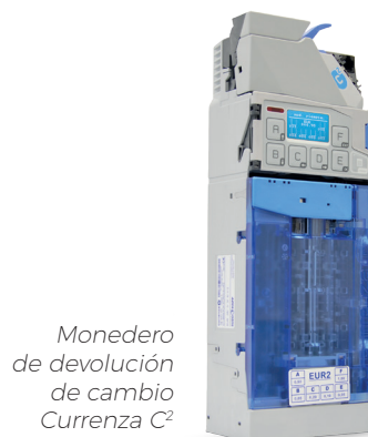
Monedero de devolución de cambio Currenza C 2